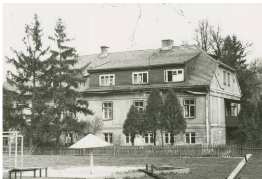
Marvos dvaro rūmai sovietiniais metais

Kaunas ir jo apylinkės / Pranas Juozapavičius. – Kaunas, 1980. – P. 449.