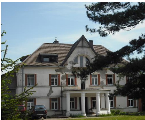
Vytėnų dvaro rūmai. 2012 m.