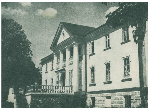
Aukštosios Fredos dvaro rūmai. 1968 m.

Kaunas ir jo apylinkės / Pranas Juozapavičius. – Kaunas, 1980. – P. 393.