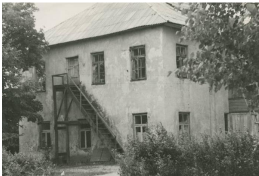
Romainių dvaro pastatas. 1967 m.

Kaunas ir jo apylinkės / Pranas Juozapavičius. – Kaunas, 1980. – P. 187.