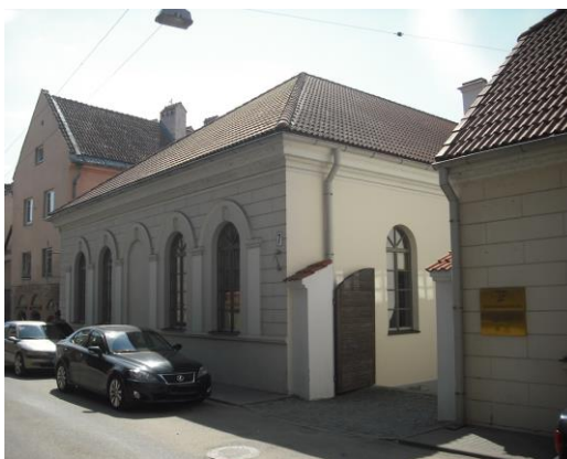
Miesto dvarelio kompleksas. 2012 m.