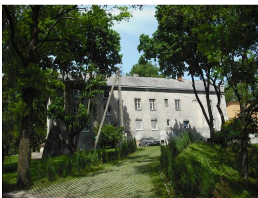
Linkuvos dvaro rūmai. 2012 m.