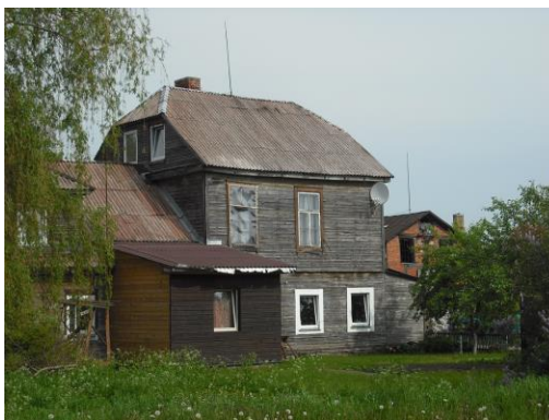
Tirkiliškių dvaro sodyba. 2012 m.