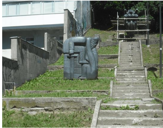
Skulptūra „Atsisveikinimas“. 2019 m.

Vieta: prie Kauno menininkų namų (V. Putvinskio g. 56)