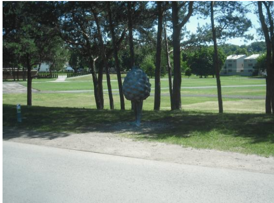
Skulptūra „Žmogus-kankorėžis“. 2019 m.