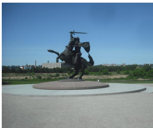
Skulptūra „Laisvės karys“. 2019 m.