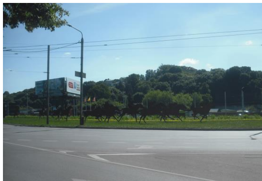
Skulptūrinė kompozicija „Lenktynės“. 2019 m.

Vieta: transporto žiedas ties Jurbarko, Jonavos ir Šauklių gatvių susikirtimu