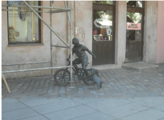
Skulptūrinė kompozicija „Nežiopsok!“ 2019 m.

Vieta: Vilniaus gatvė greta sankirtos su J. Gruodžio g.