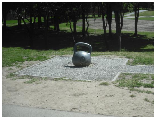
Skulptūra „Gyra“. 2019 m.